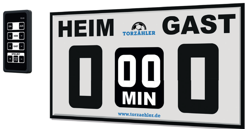
Fernbedienung FB M3 und Fußballanzeige FAS 400/2

Den Torzähler haben Trainer, Spieler und Zuschauer immer im Blick. Sichern Sie sich deshalb Ihren Platz auf den Werbeflächen rund um die Spielstandsanzeige.